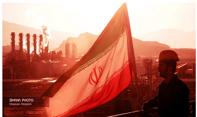
SHAMA PHOTO Hasaan Hosaini